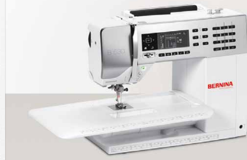
B 530 mit Anschlagetisch

Ob beim Nähen oder Quilten: Bei der BERNINA 530 und 570QE ist die Verbindung von modernem Design und hoch entwickelter Technik selbstverständlich. Denn die BERNINA Ingenieure sind der Ansicht, Technik sollte nicht nur ihren Zweck erfüllen, sondern auch in Form und Design für einen kreativen Lifestyle stehen.